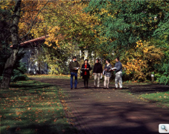
Студенти в парку Натолін